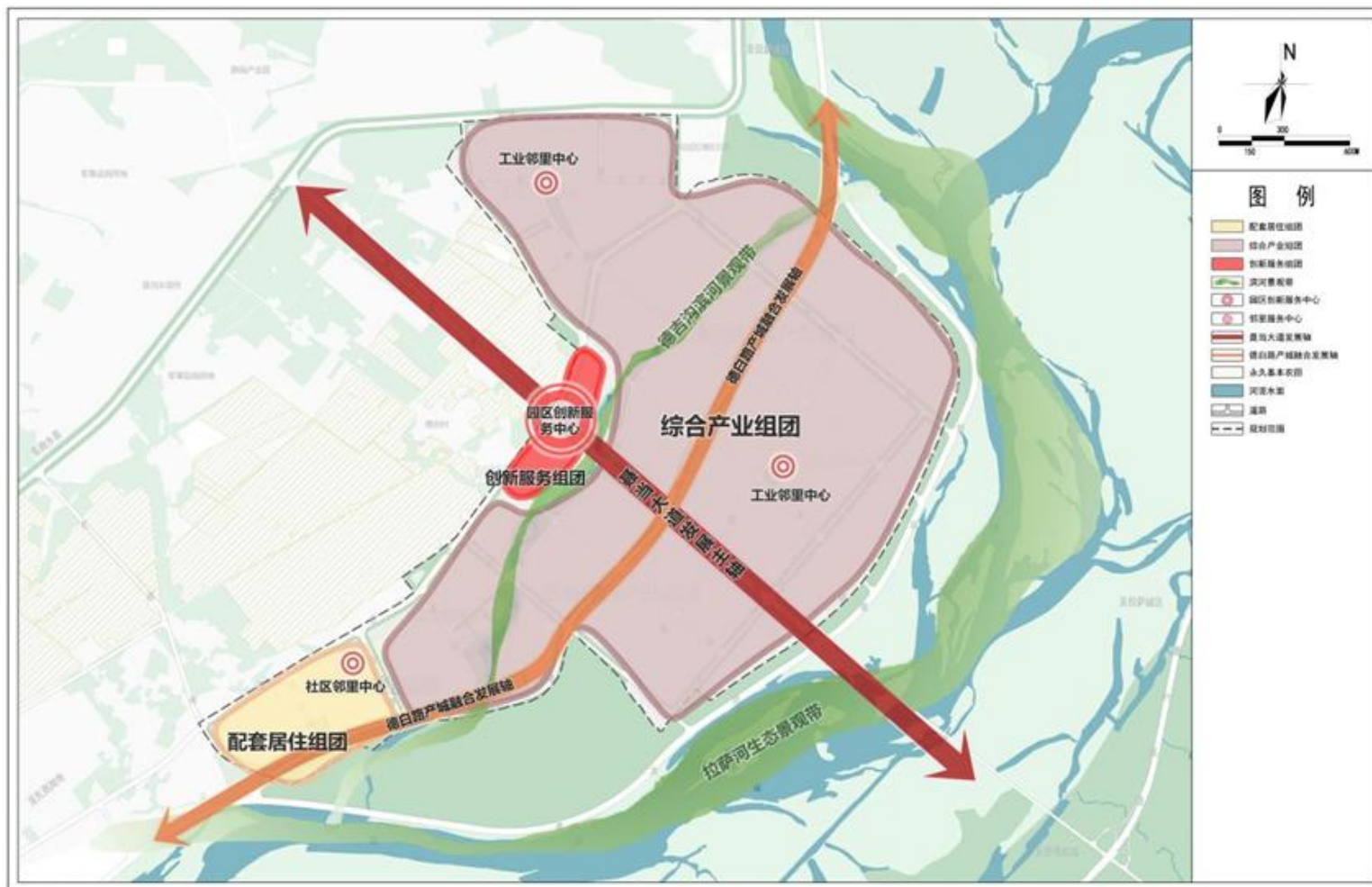
图3 “十五五”时期聂当工业园空间布局示意图